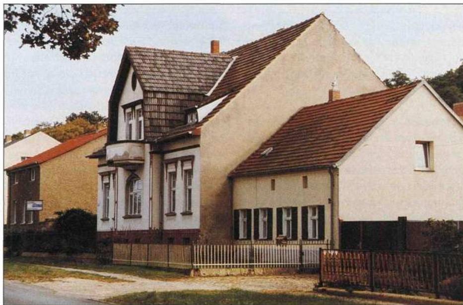
Bild 4: Oft stehen unterschiedliche Hausformen in direkter Nachbarschaft wie hier in Bornim bei Potsdam

genwärtige städtebauliche Situation mit ihren Eigenarten und Probleme bewertet. Des Weiteren sind die möglichen und aus Sicht der jeweiligen Problemlage empfehlenswerten städtebaulichen und bauordnungsrechtlichen Planungsinstrumente im Leitfaden genannt. Die Aufzählung enthält alle sinnvollen Varianten. Vorteile, Nachteile und Grenzen der Verfahren werden erläutert. Die Entscheidungen müssen letztlich unter Berücksichtigung der kommunalpolitischen bzw. baupolitischen Zielsetzung durch die Gemeindevertretungen getroffen werden.