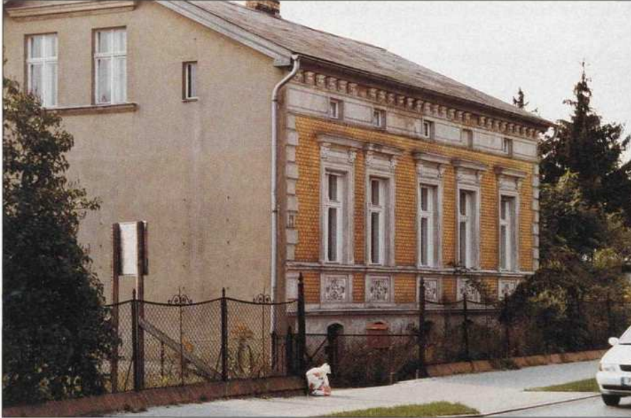
Bild 1: Regionaltypische Ziegel-Stuck-Fassade in Neu Geltow um 1890

Ein vom brandenburgischen Agrar- und Umweltministerium geförderter Gestaltungsleitfaden für die Region Potsdamer Havelseen soll zu einer harmonischen Siedlungsentwicklung beitragen. Es werden Empfehlungen zur Erhaltung und Gestaltung von historischen ländlichen Wohngebäuden und Gebäudeensembles in einem traditionell geprägten Umfeld gegeben. Die Dokumentation ist in kurzer Zeit zu einem wichtigen Instrument der Dorferneuerung geworden.