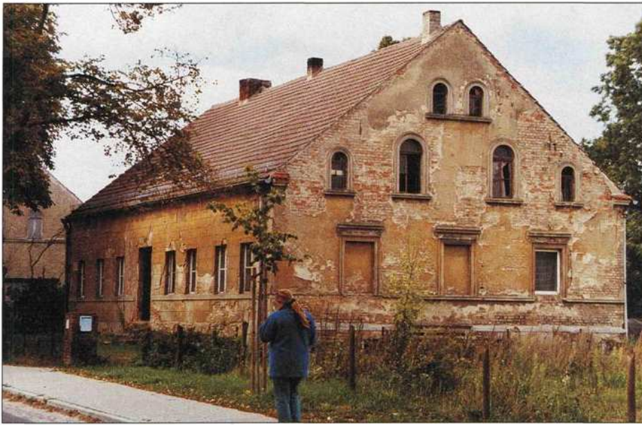
Bild 3: Großbauernhaus im Zustand des Verfalls in Seeburg um 1880