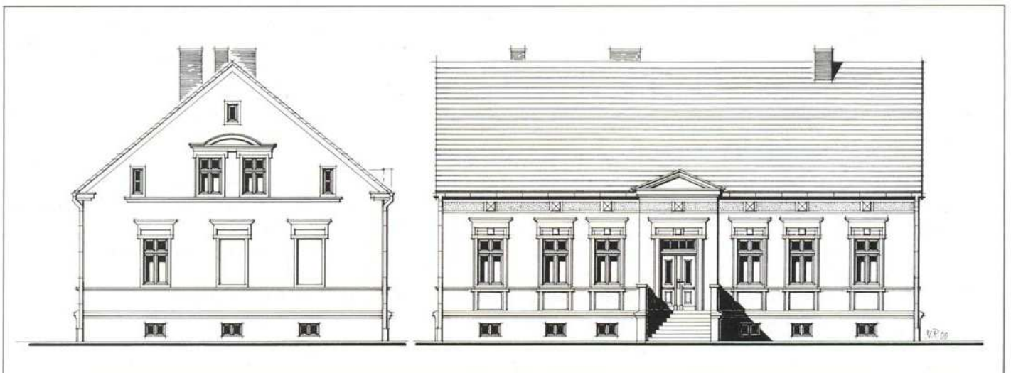
Bild 6: Großes Bauernhaus mit übergiebeltem Risalit um 1870-1880

hat eine zweiflügelige Haustür mit Kämpfer und Oberlicht, wie sie noch vielfach in der Region anzutreffen ist (Bild 5). Wer Originaltüren dieser Art für Sanierungsarbeiten sucht, kann bei regionalen Händlern für historische Bauelemente fündig werden. Der Eingangsbereich des gezeichneten Haustyps ist deutlich betont durch einen übergiebelten Risalit mit Freitreppe; die Giebelseite zeigt zwei Blendfenster, die nur der Fassadengestaltung dienen. Der noch relativ zurückhaltende Fassadenstuck orien-