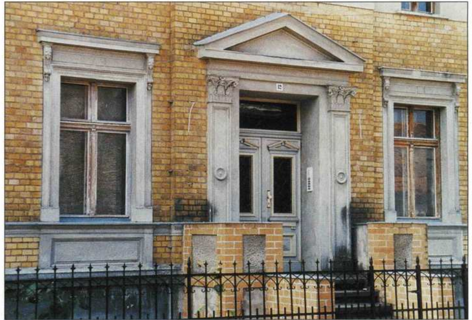
Bild 5: Tür-, Fenster- und Fassadengestaltung in Petzow um 1870-1900

Typisch für die Region waren um 1870 bis 1900 4-achsige Gebäude sowie kleine 3-achsige „halbe“ Häuser. In beiden Fällen handelt es sich um rückseitig erschlossene, voll unterkellerte Gebäude mit hohem Kellersockel und flach geneigten Satteldächern mit Drempeel und Drempeelfenstern. Die Hauptfenster besitzen den zeittypischen Kämpfer, die Unterflügel der Fenster haben jedoch schon keine Sprossen mehr (im Gegensatz zu den älteren märkischen Wohnhäusern vor etwa 1880). Typisch für Gebäude der Gründerzeit ist ein historisierender und besonders in der Spätzeit teilweise stark profilierter Fassadenstuck. In vielen Fällen ist die Erdgeschosszone der Straßenfassade durch eine Ziegelverblendung zwischen Eckquaderung und Stuckteilen gestaltet (Bilder 1 und 5). Der Sockel ist in der Regel nur verputzt. Die meist gelbe oder ockerfarbene Ziegelverblendung ist eine ganz besonders regionaltypische Erscheinung. Sie geht auf die hiesige, im letzten Viertel des 19. Jahrhunderts sehr wirtschaftsstarke Zie-